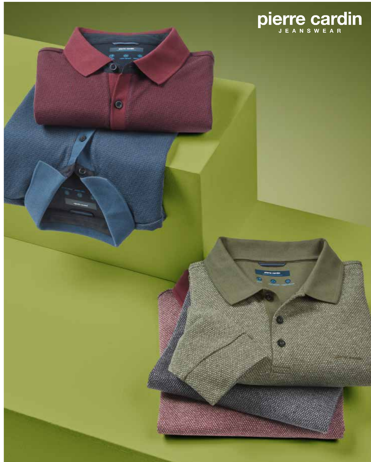
POLO-SHIRTS , reine Baumwolle. Pierre Cardin, je 79.99€