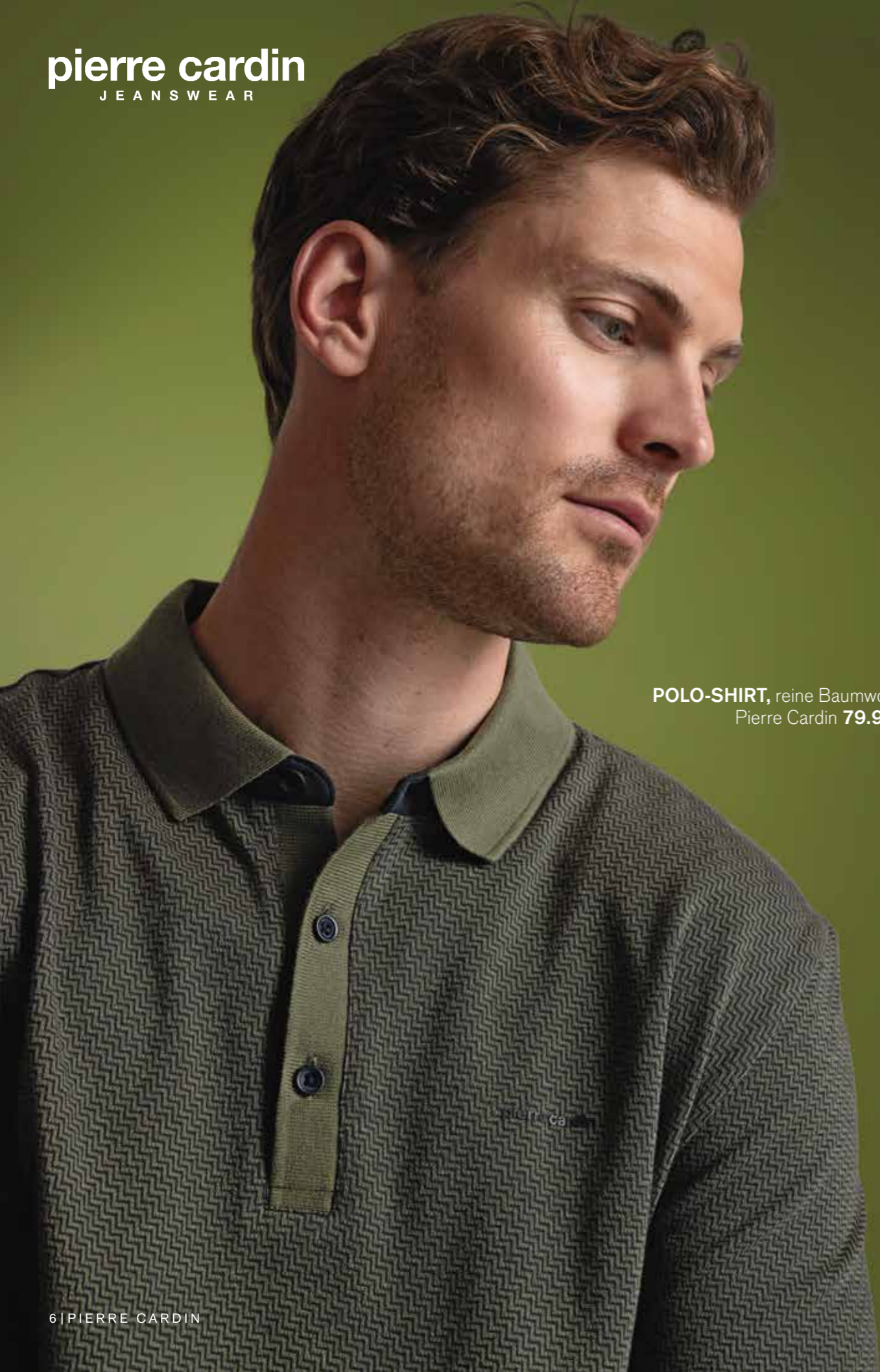
POLO-SHIRT , reine Baumwolle. Pierre Cardin 79.99€