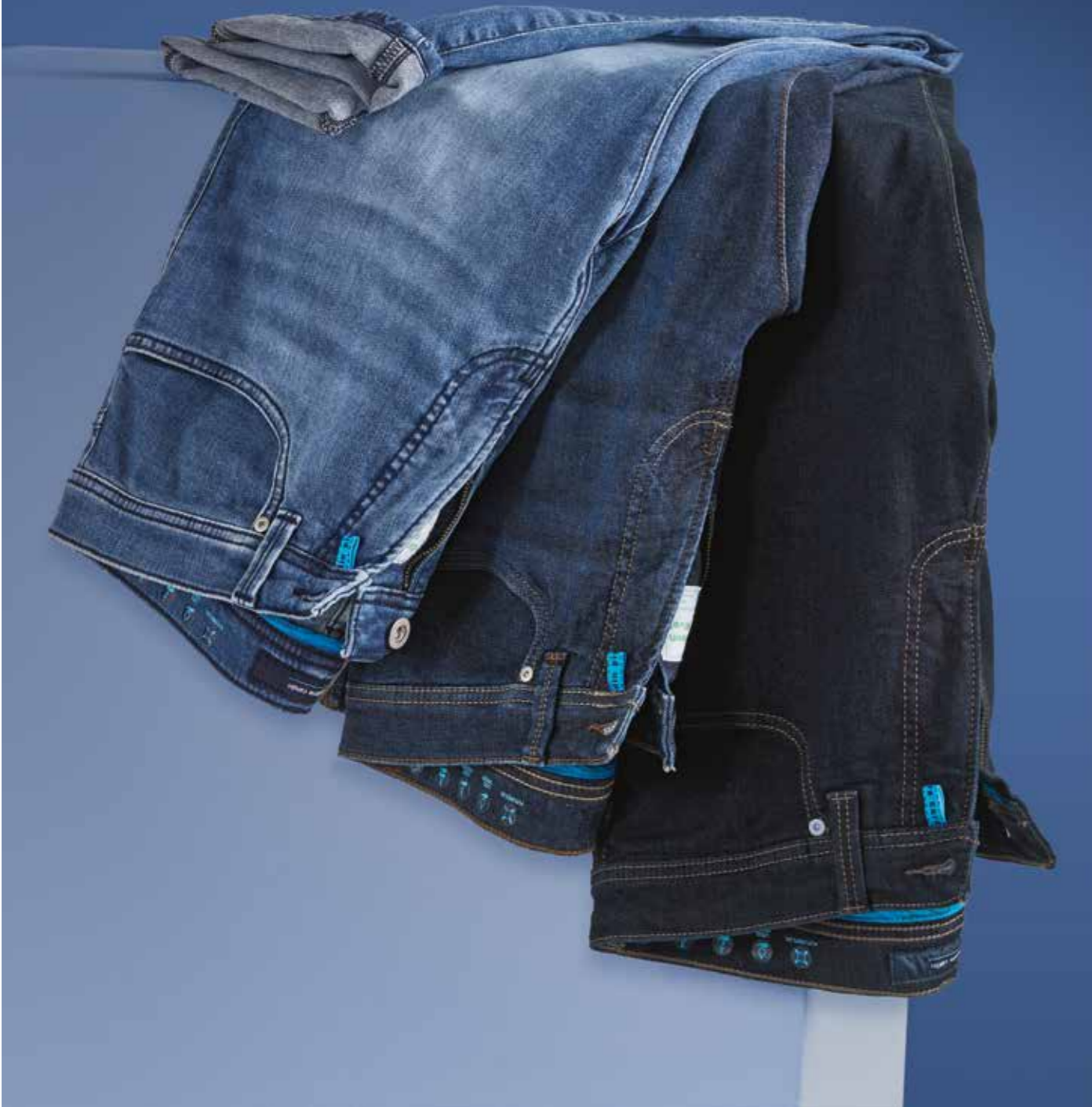
FUTURE-FLEX-JEANS Pierre Cardin, je 99.99€ / 109.99€