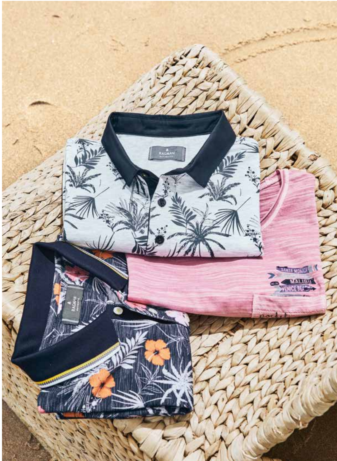
Baumwoll-Polos RAGMAN, je 59.95€ T-Shirt RAGMAN 39.95€