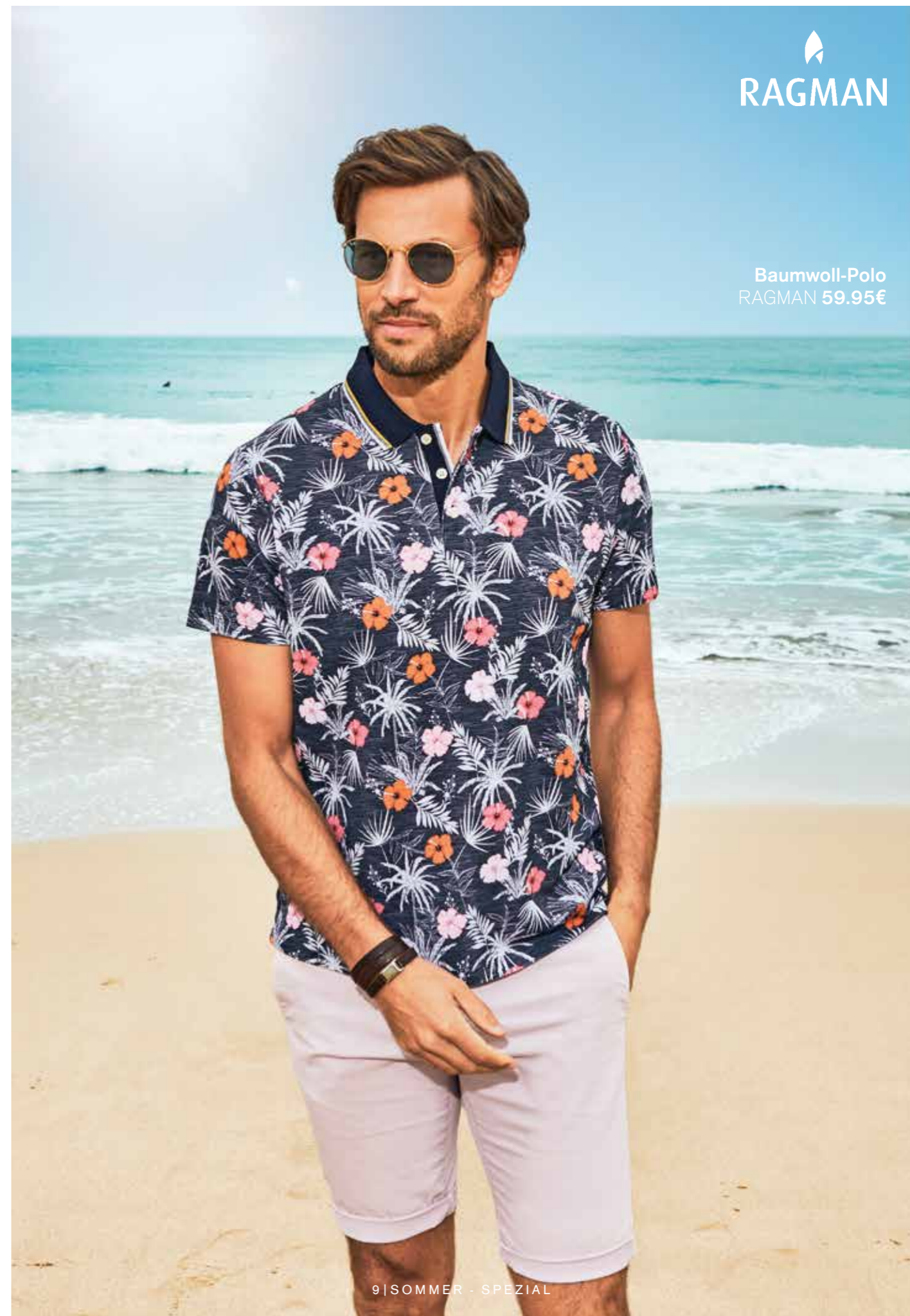
Baumwoll-Polo RAGMAN 59.95€